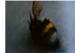
Ella Detmar (vierde jaar). Hommel, olieverf (2019)