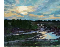
Ingrid Struijs (derde jaar). Landschap na de regen, olieverf (2020)