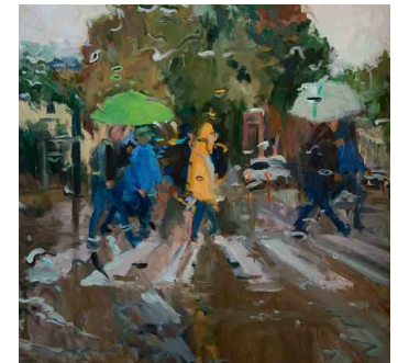
Melda Wibawa (afgestudeerd). Rain on me (24), olieverf (2019)