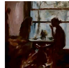
Alien Fardin-de Bruin (derde jaar). Schetsopdracht in olieverf (2020)